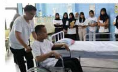
東京から帰国したインドネシア大卒者、日本の介護職など人気 国内就職難で受け皿に

インドネシアで最早期の留学生が日本で働くよう特定技能の資格取得を目指す動きが広がっている。大卒の求職者は10万人以上に上るほどの若年層の就職難が背景にお