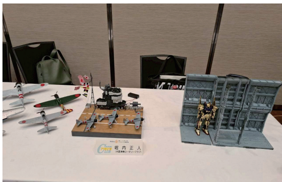
◇ プラモデル同好会 堀内会員の作品