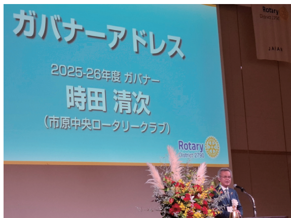
◇時田ガバナー挨拶