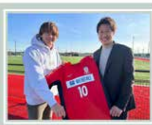
市議会議員 ✕ サッカー選手