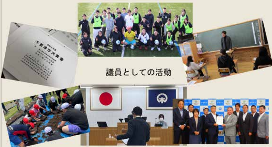
議員としての活動