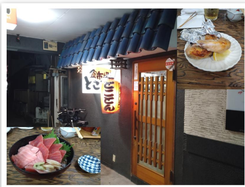
右上の写真は「手羽先」。左下の写真は「まぐろ丼」。 店舗住所とコメントは週報の最後で！

◆出席 会員46名 ◆出席率 68.29% 出席28名 ◆修正前出席率 75.00% 欠席18名 ◆修正後出席率 79.54%