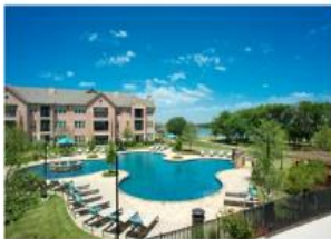
大和ハウス工業 海外事業 賃貸住宅 アメリカ：