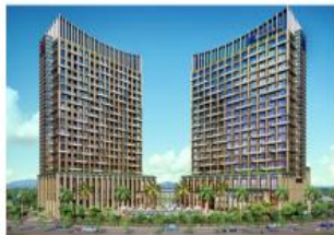
大和ハウス工業 海外事業 ホテル ベトナム：