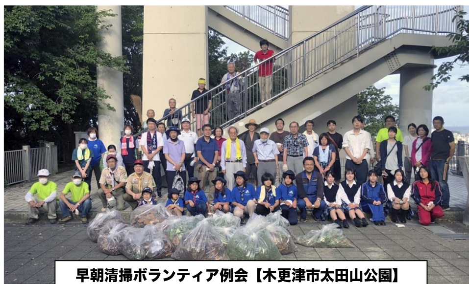
早朝清掃ボランティア例会【木更津市太田山公園】