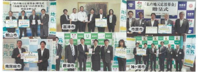
管内自治体との連携 ※本支社中、鴨川市、館南町は協定締結時に贈呈しました。(次回当選時)

地域住民の健康づくりや暮らしの充実に向けた当社との協働取組みにお役立ていただくべく、当社の営業拠点が所在、または連携協定を締結している自治体等全国1,018団体に対して寄付を実施しました。私たち千葉南支社は、管内9自治体に約512万円を寄贈させていただきました。