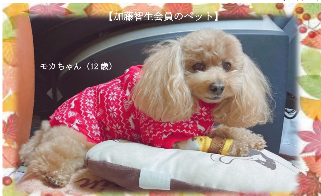
モカちゃん (12 歳)