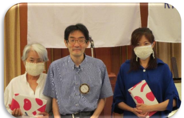
◇事務局の皆さんへ