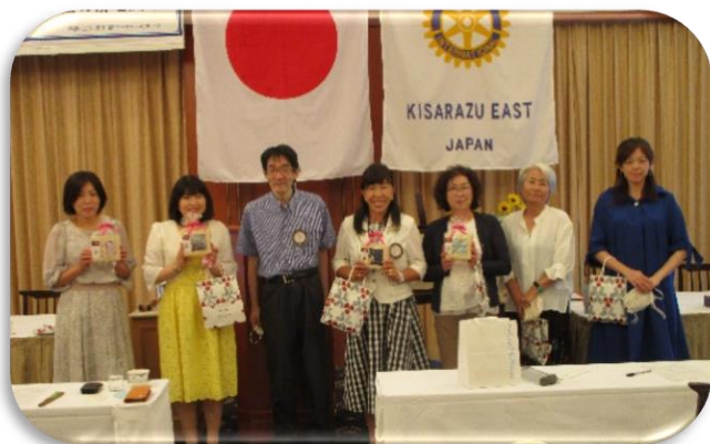
◇女性会員の皆さんへ