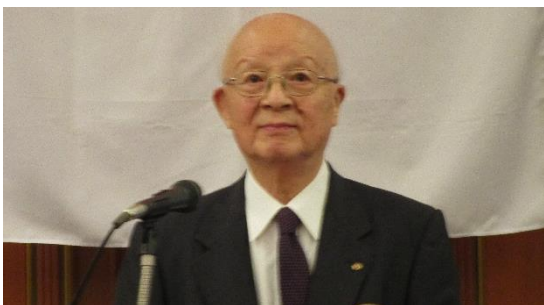
2500回例会おめでとうございます。

1968年6月26日に当クラブは創立されました。2500回目の例会は大きな節目です。創立時から在籍している私にとっては、まことに感慨深ものがあります。半世紀を超えて52年間も会員であり続けたのは、我ながらよくも続いたものだと思います。とにかく今日の2500回例会を皆さん共々大いに祝福したいと思います。