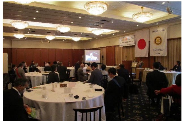
【木更津東リモート風景】