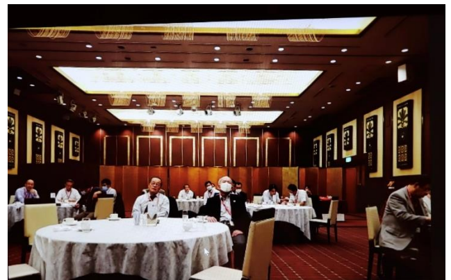
【坂出東リモート風景】