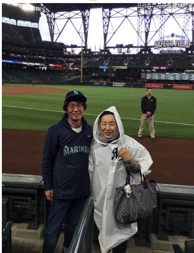
2018 年