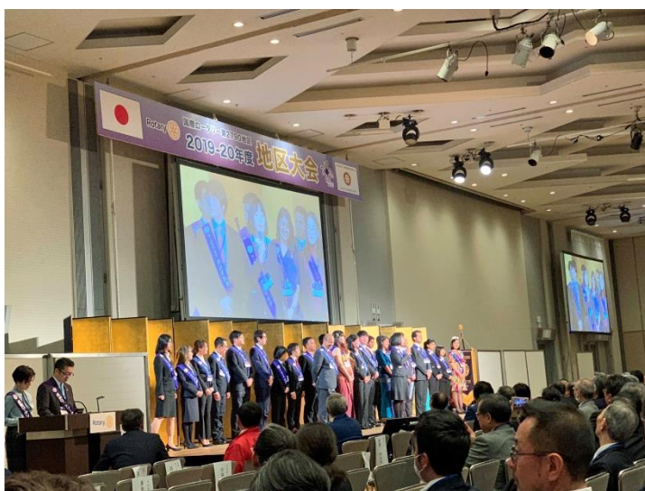
アパホテル&リゾート 《東京ベイ幕張ホール》

◆出席 会員 46名 ◆出席率 44.73 % ◆前々回出席率 69.23 % 修正後出席率 84.61%