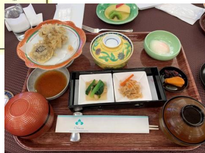
点鐘 加藤智生会長 13:30