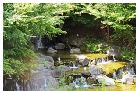
《例会場から見えるお庭は涼しげでした》