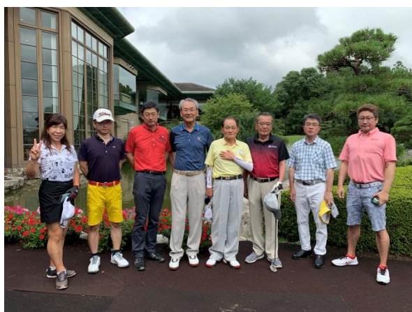
《皆さん、ベストドレッサー賞差し上げます！》 素敵ですね