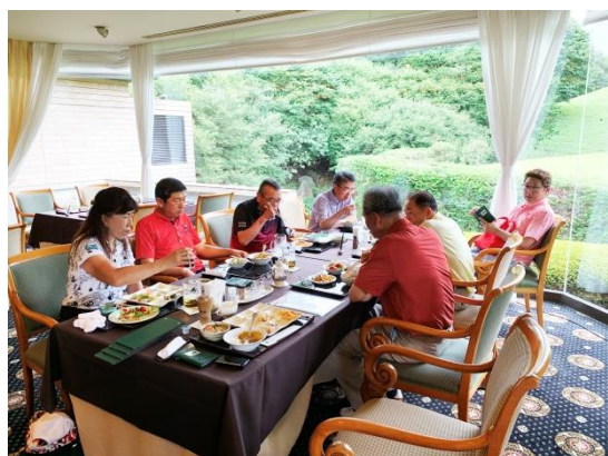
《なにやら美味し気なランチタイム》