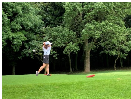
《宮寺会員 ナイスショット！？です。》