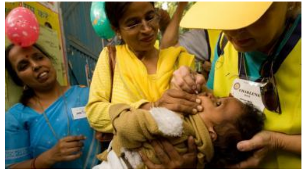
〈ポリオワクチン接種風景〉